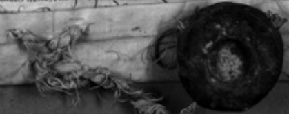
До док. № 93